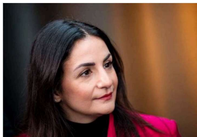
Kulturminister Parisa Liljestrand (M).

Men inom litteraturen har vi redan en inofficiell kanon. Svensklärare ägnar en stor del av sin utbildning åt litteraturvetenskap. Det finns på de flesta skolor kompetens att guida eleverna ge-