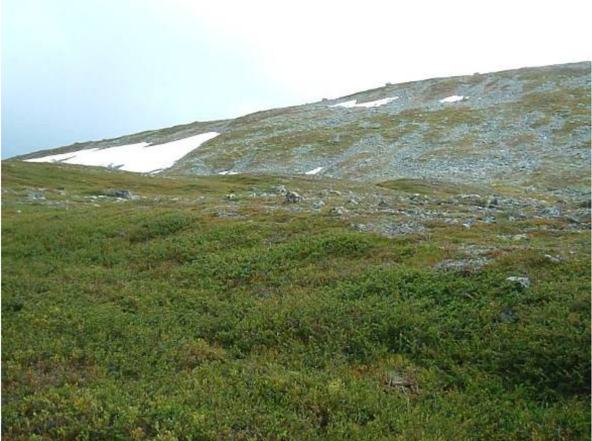
Tillbakablick mot topp nr. 6