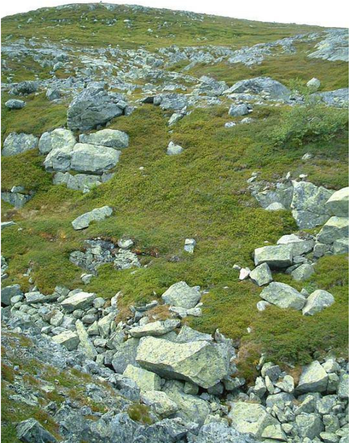
Mot topp nr. 3