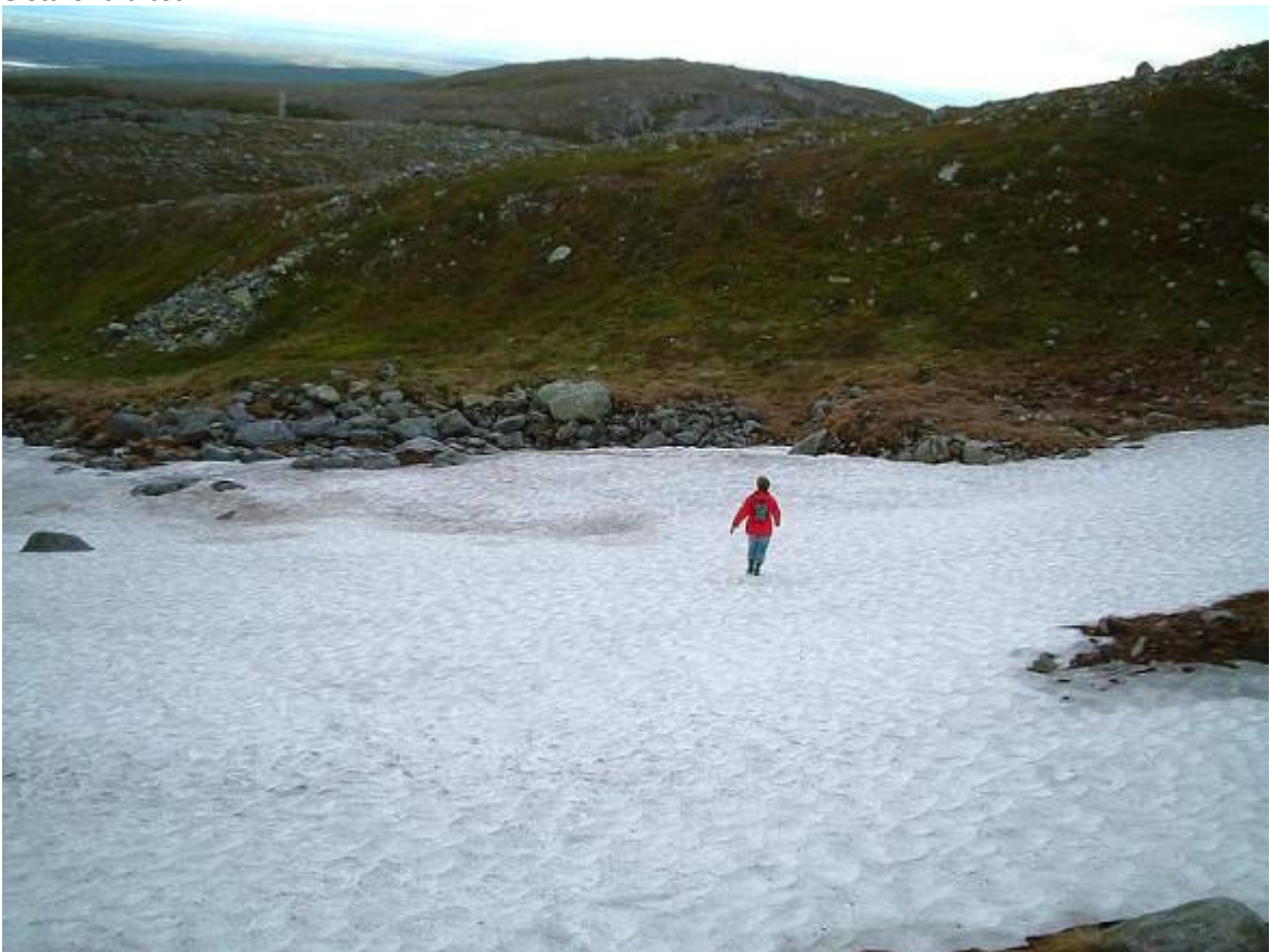
Här var det stövlarna på. M.a.o. är bilderna på denna sida från olika års julimånader.