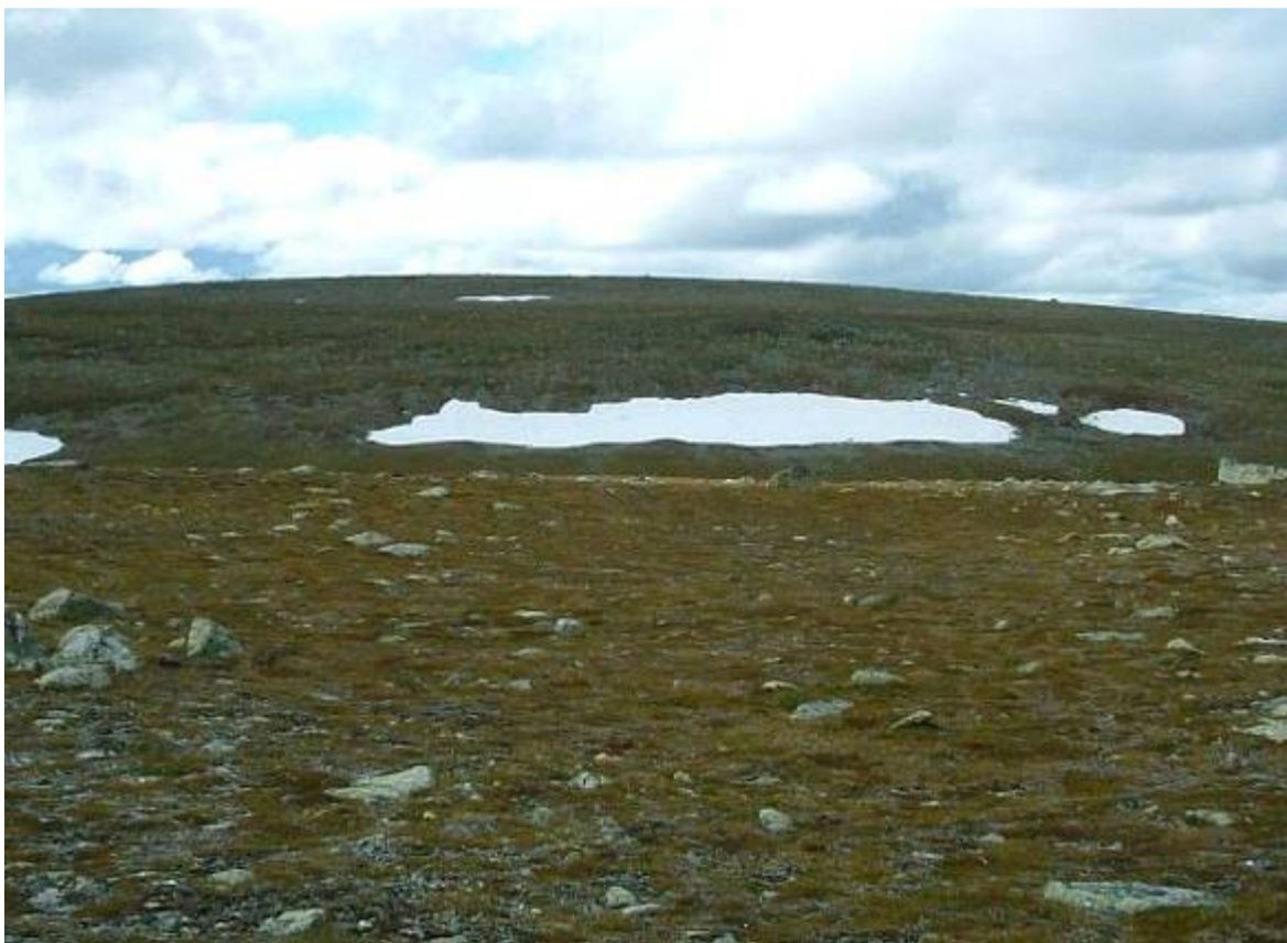
Mot topp nr. 7 = västra toppen 1200 m ö.h. Vandringen gick inte dit utan fortsatte på topp nr. 6 norrut innan nedstigningen påbörjades.