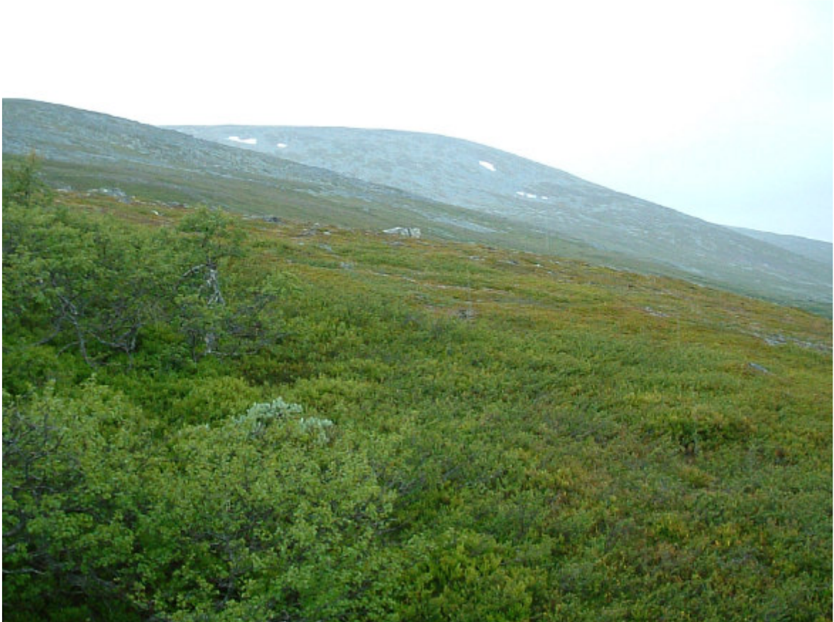
Tillbakablick från ung. (ngt. norr om) samma plats som bilderna på sid. 3. Nedan 180 grader