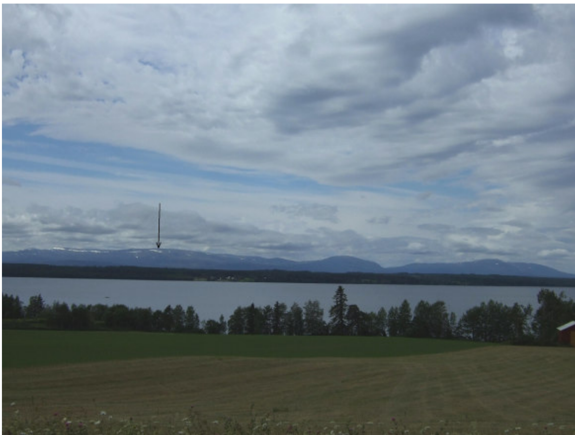
Här syns Österfjället med Storsjön i fronten.