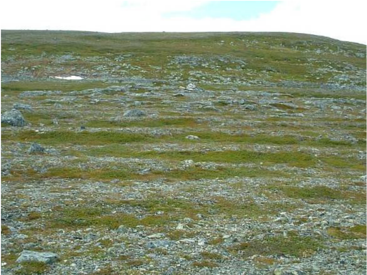
Mot topp nr. 4