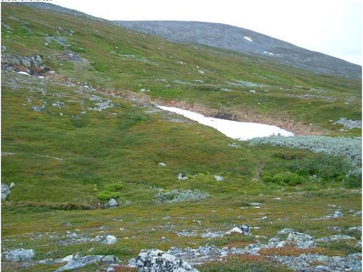
Vi var ända där uppe vid horisonten på topp nr. 6