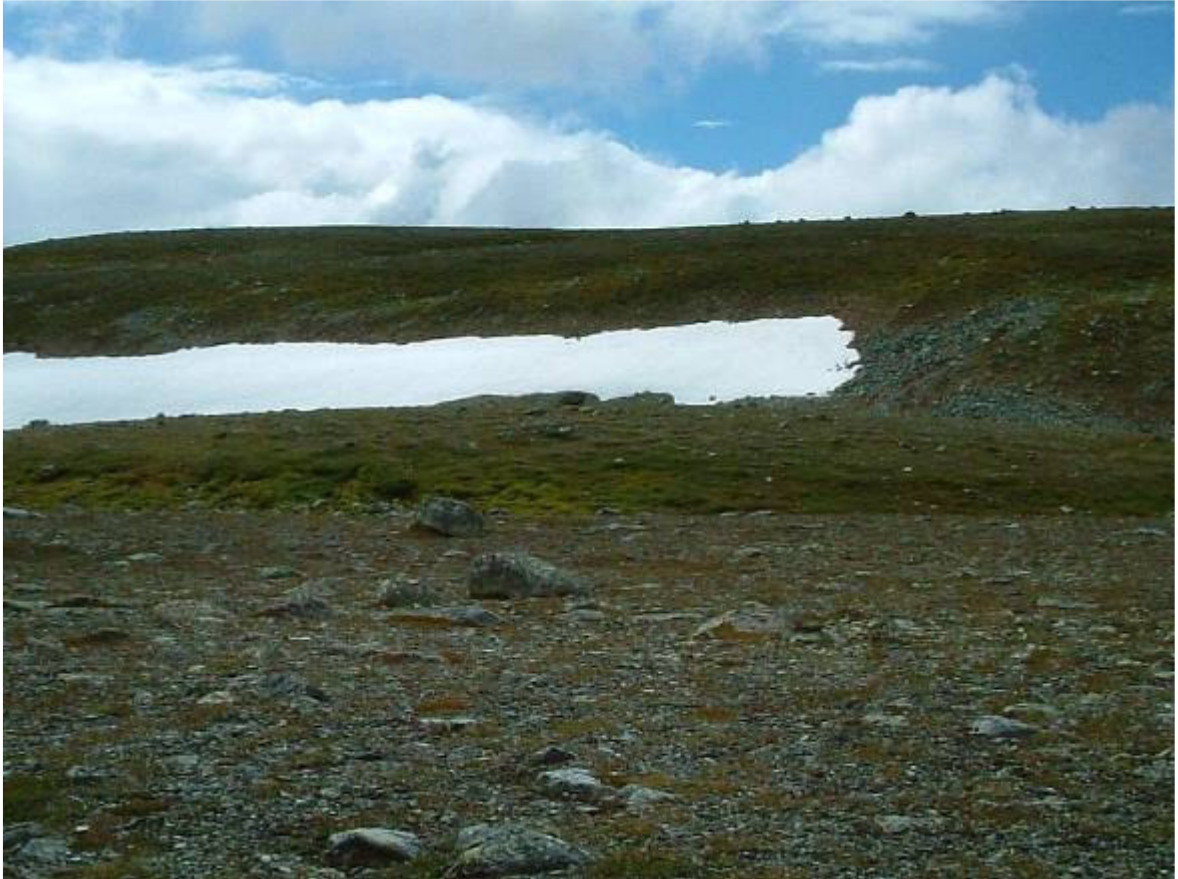
Mot topp nr. 5 som heter Klevfjället och som gett namnet till Klevfjällsbyn.