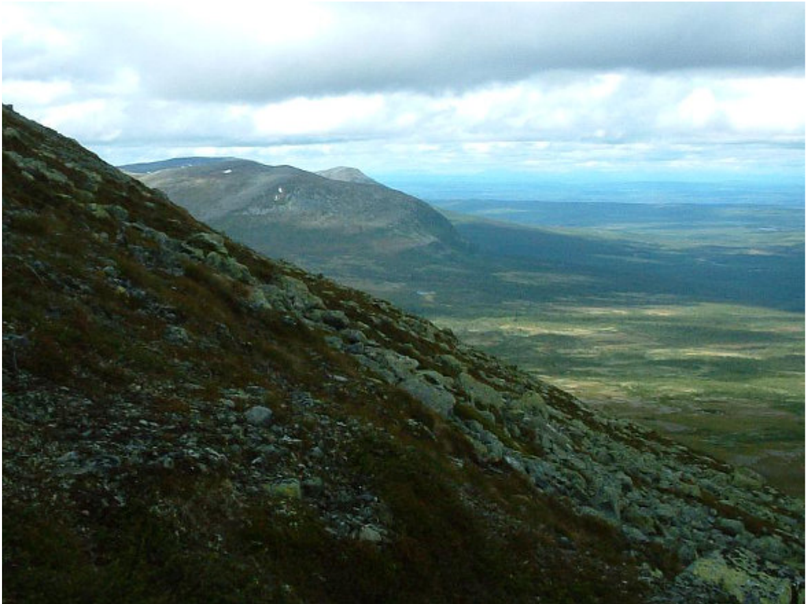
Drommen med Västfjället bakom och Bydalen mittemellan.