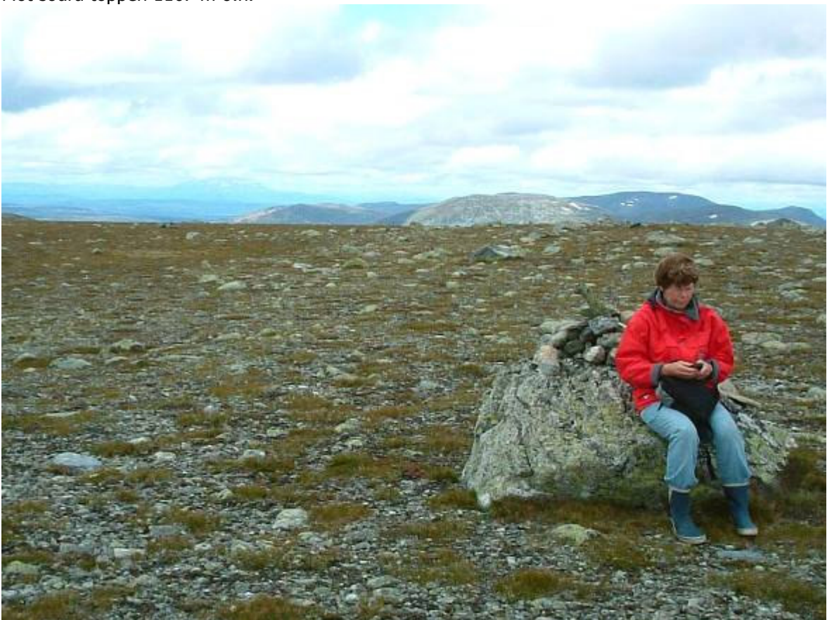
Åreskutan skymtar till vänster i fjärran. Syns mycket bra vid klart väder.