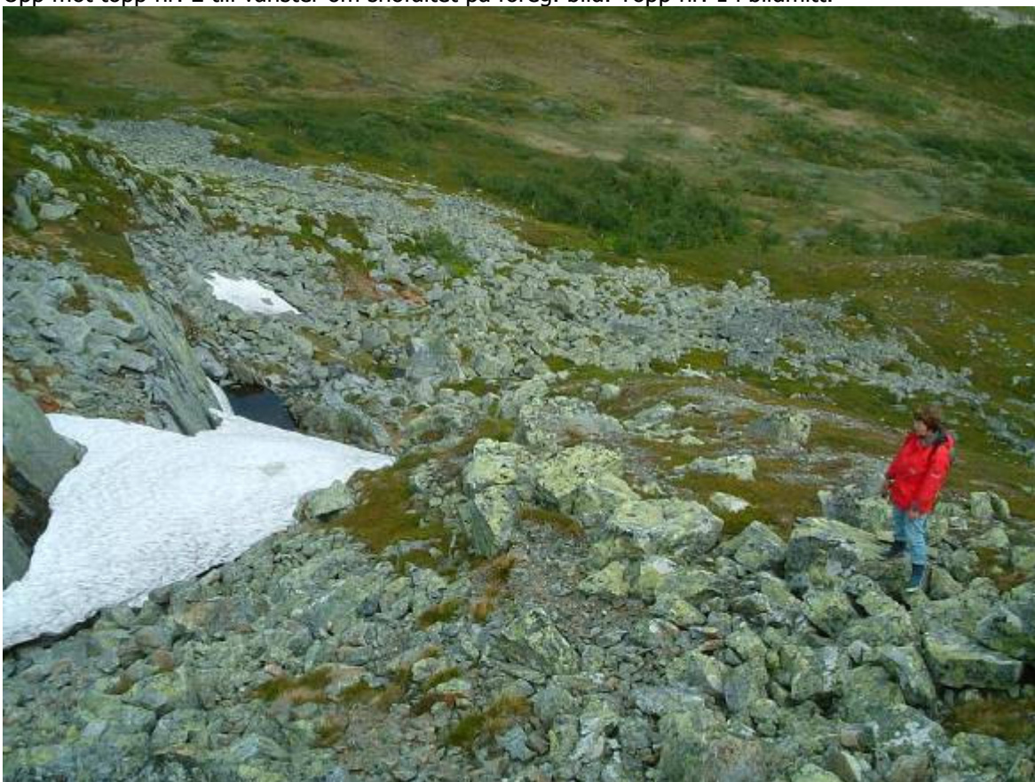
Samma som bilden överst men zoomat och kameran vriden ngt. åt vänster.