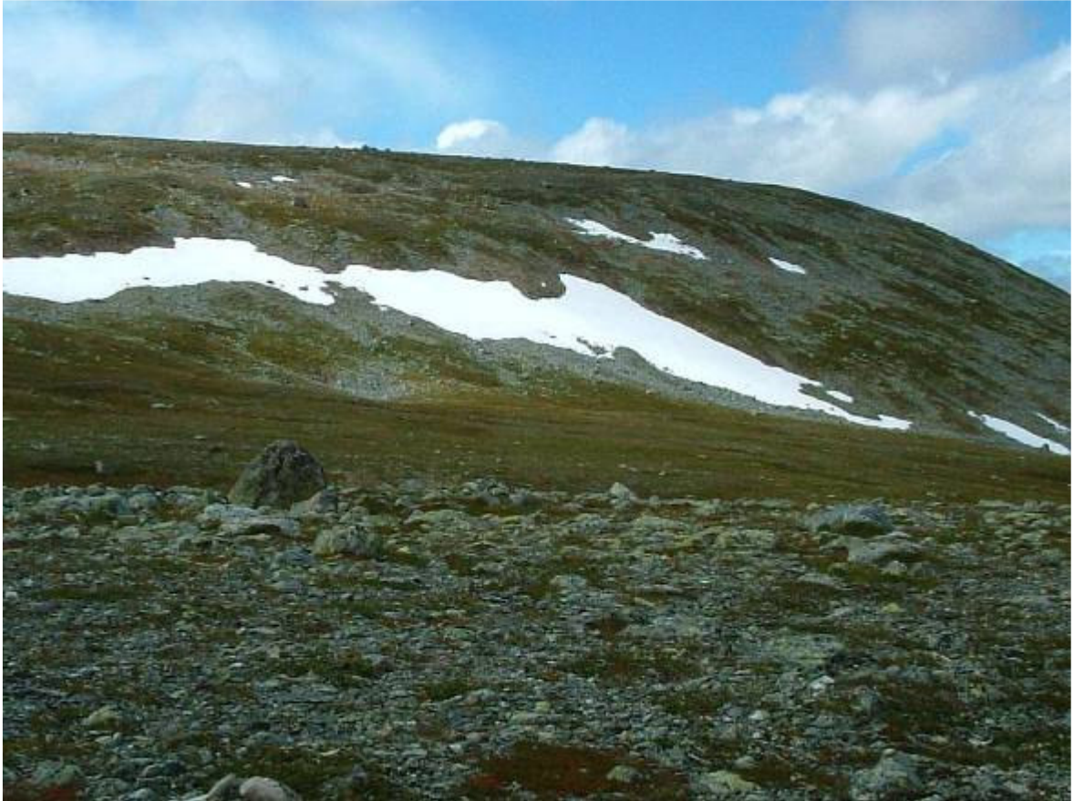
Mot topp nr. 6 = östra toppen 1170 m ö.h.