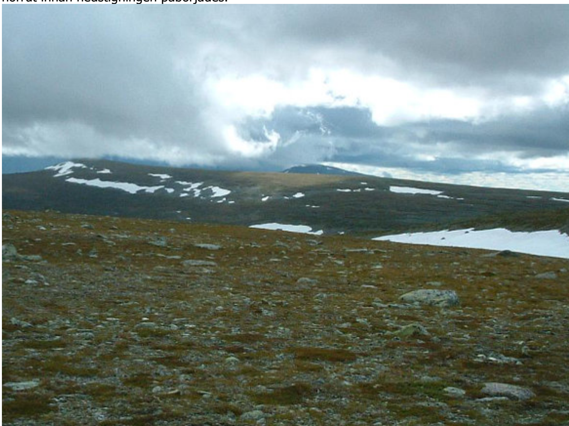
Storfjället 1250 m ö.h. och Hundshögen 1371 m ö.h.