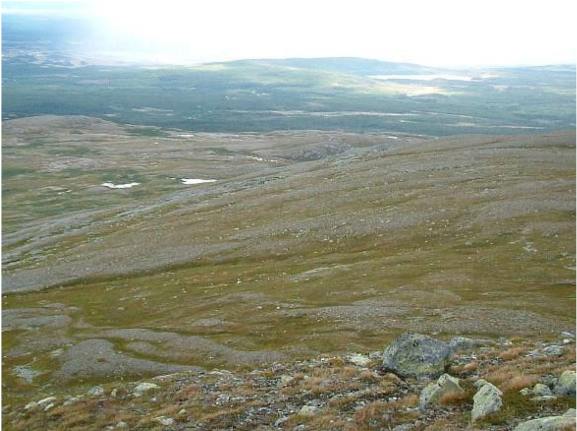
Rakaste och brantaste vägen ner ngt. norr om uppstigningen. Häggsåssjön till höger. Storsjön fortfarande i moln. – Se bilderna på sid. 1!