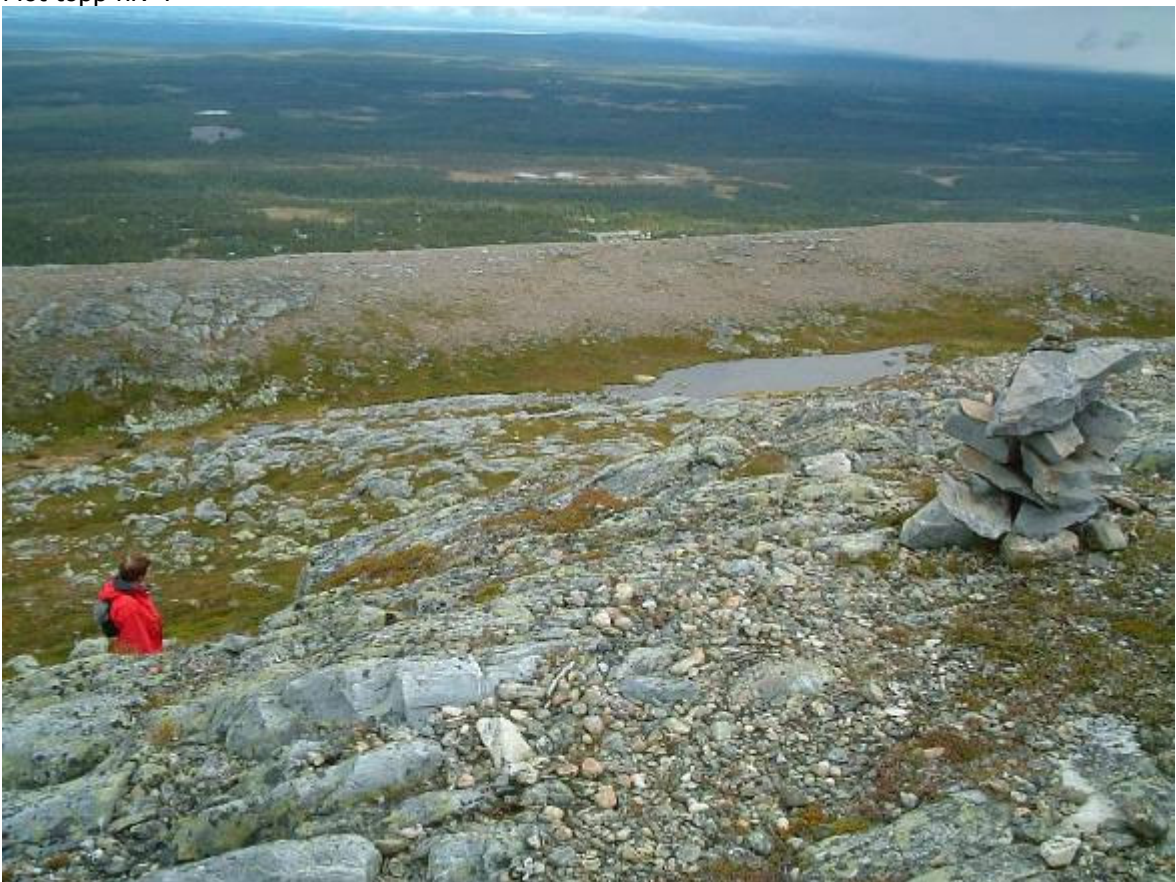
Tillbakablick mot topp nr. 3. Stugorna i Klevfjällsbyn till vänster. Fjällgården i mitten.