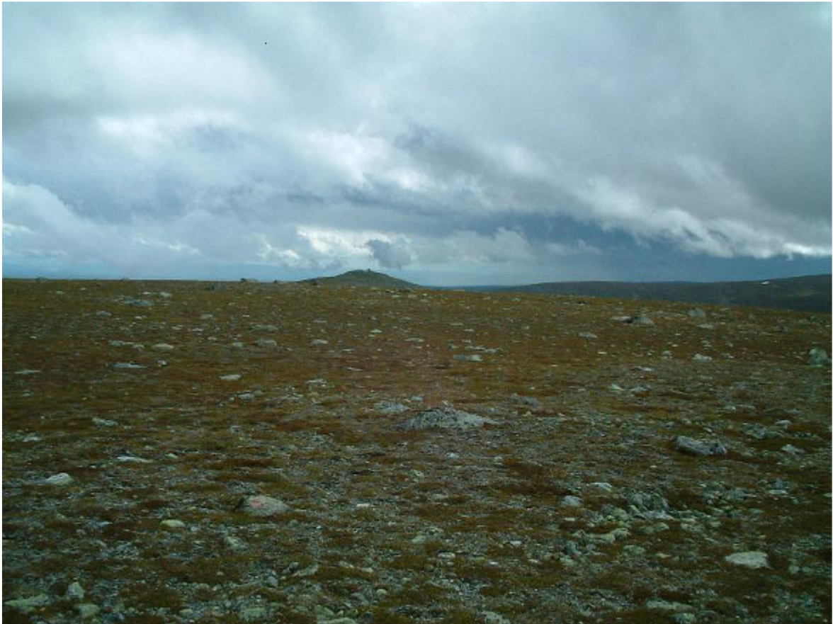
Mot södra toppen 1167 m ö.h.