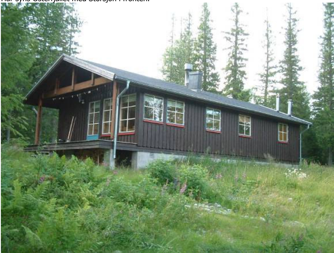
Här startar vår vandring uppåt på vägen bakom huset.