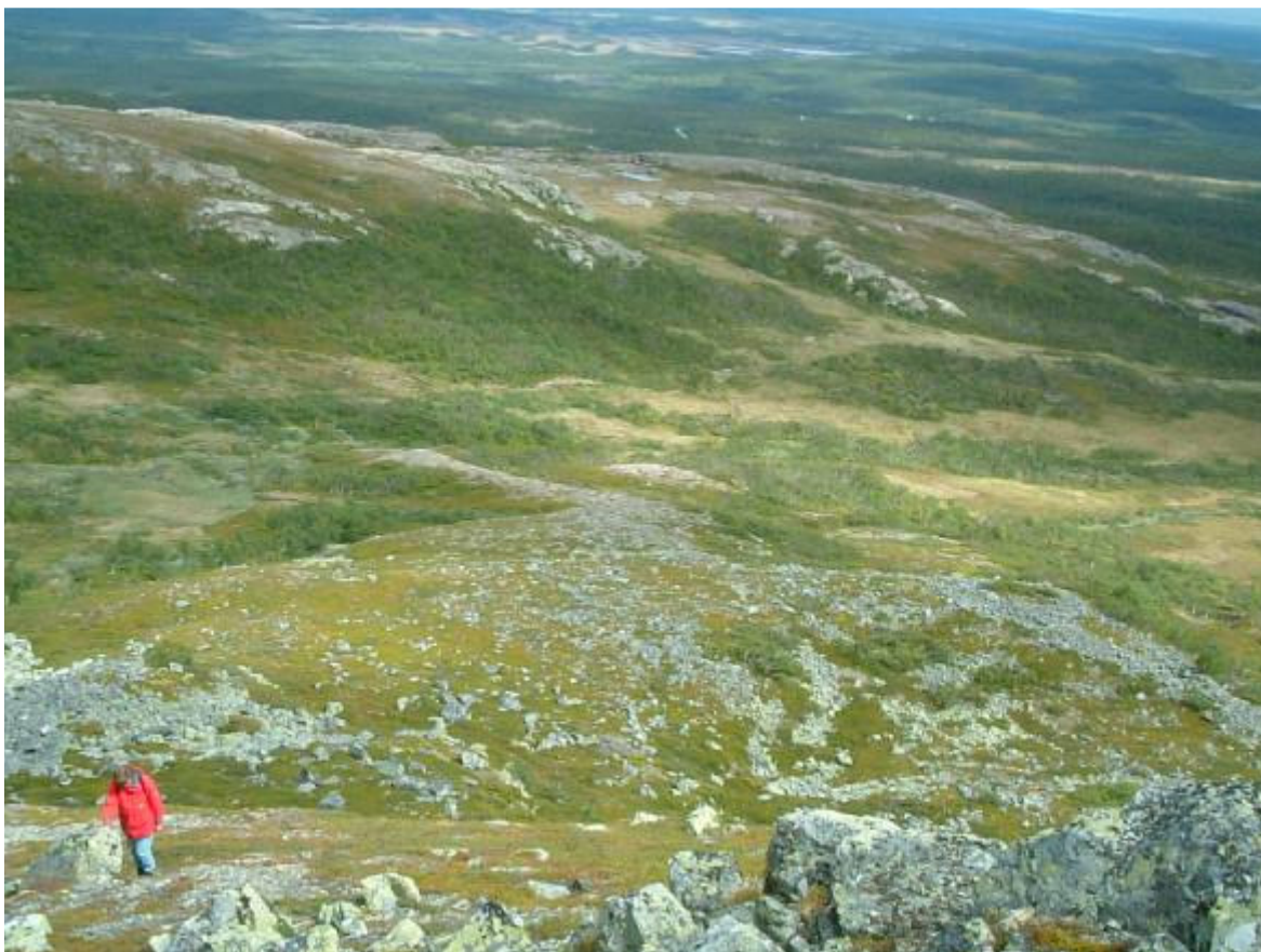
Upp mot topp nr. 2 till vänster om snöfältet på föreg. bild. Topp nr. 1 i bildmitt.