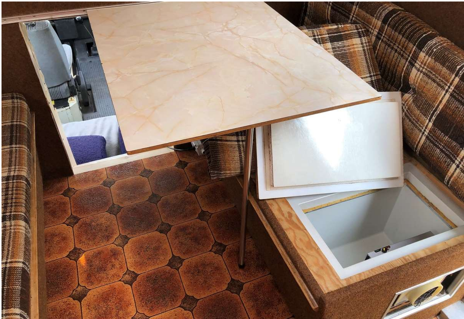
Elektriskt kylskåp med SuperCool-funktion = mycket energisparande. Bruksanvisning kan mailas.