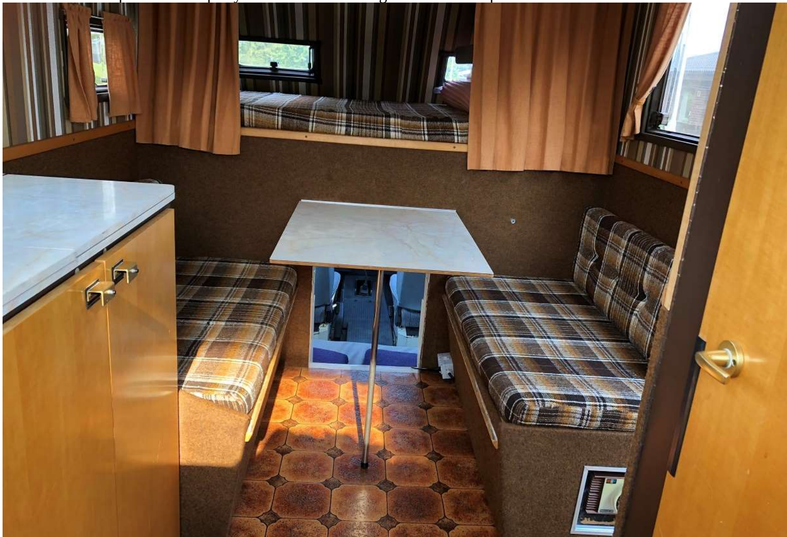
Bordet kan skjutas åt höger eller lyftas bort. Stora förvaringsutrymmen under båda soffbänkarna.