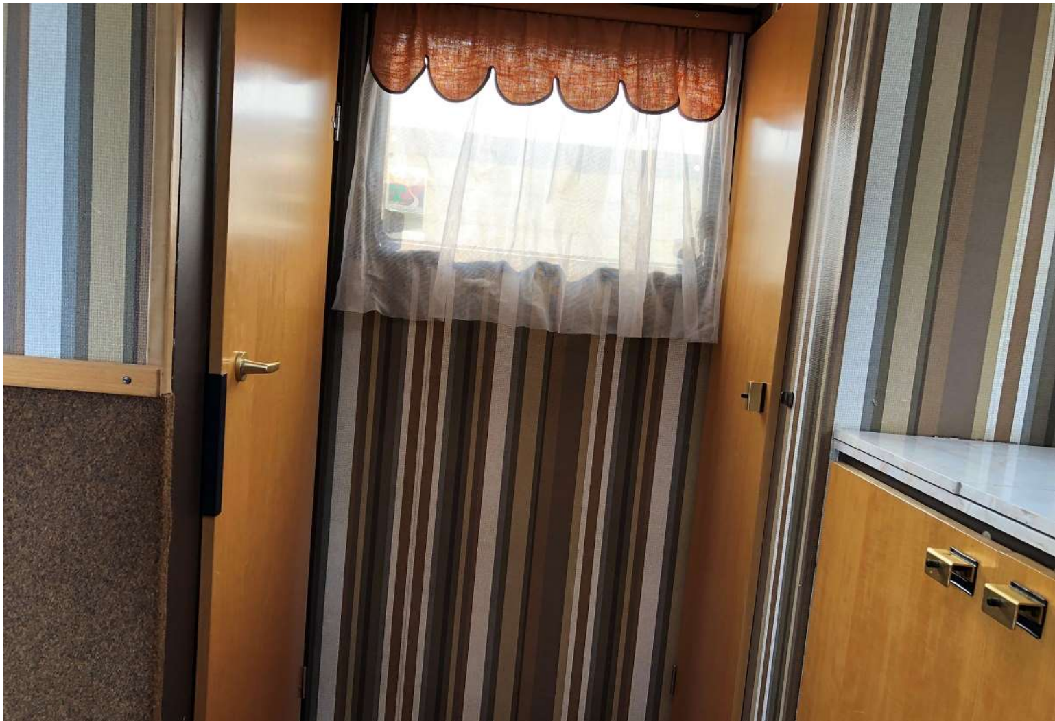
Dörr till vänster till tvätt, toalett och dusch – vi tittar in här på sista sidan. Dörr till höger till klädgarderob.