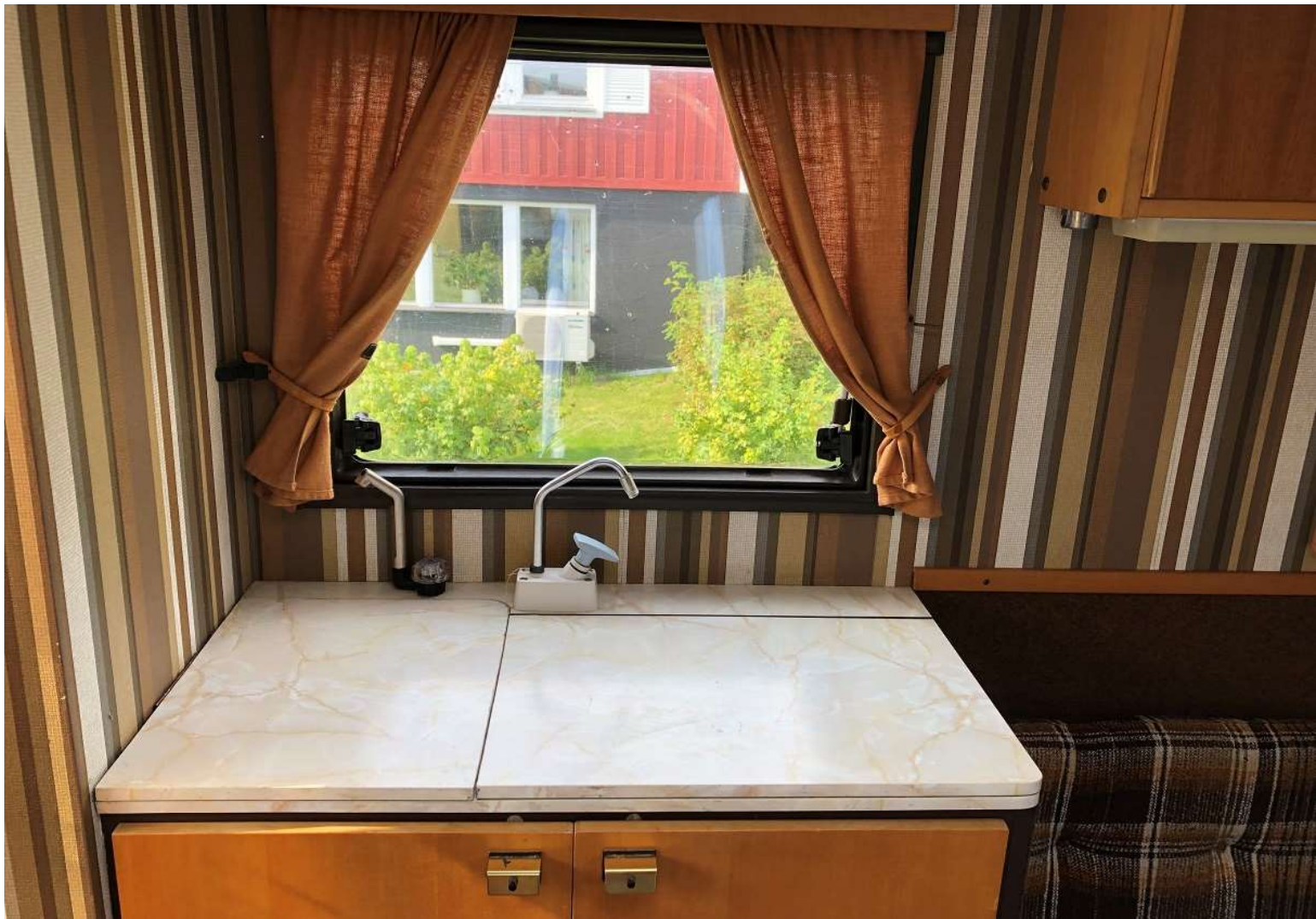
Båtkök – med T-sprit. Stort skåputrymme för skafferi/husgeråd bakom skåpsdörrarna.